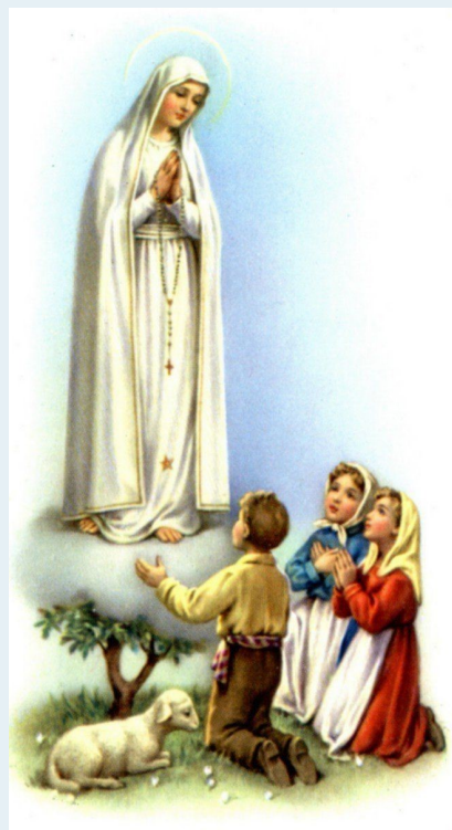
NUESTRA SENORA DE FATIMA

Los talleres Marianos de oración y formación son vía zoom de 8.30am a 11.30am.