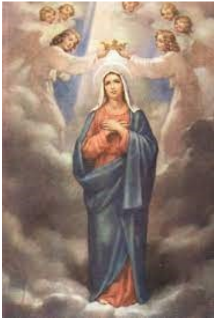
Reina del Cielo y de la tierra